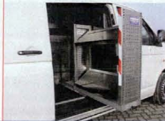
Ausbaubeispiel Volkswagen T5

Die in Stuhr (Bremen/Brinkum) ansässige Firma Eggers Fahrzeugbau ist seit Jahren weit über die Grenzen Bremens hinaus für hohe Qualität im Aus- und Umbaubereich bekannt